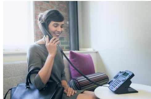
Le Polycom VVX 101 (ci-dessus) et le VVX 201 (ci-dessous) sont des solutions voix HD économiques conçus pour tous les bureaux.

Le nouveau téléphone multimédia professionnel Polycom VVX 101 est une solution économique pour les petits bureaux et les bureaux à domicile : partout où l'utilisateur a besoin d'un téléphone simple pour une seule ligne. Le Polycom VVX 201 est conçu pour les organisations de toutes dimensions qui sont à la recherche d'un téléphone économique pour une ou deux lignes et doté de nombreuses fonctionnalités professionnelles. Tous deux permettent des conversations naturelles, grâce aux technologies de dernière génération de Polycom : la voix HD, Polycom® Acoustic Clarity™ et Polycom® Acoustic Fence™ , qui assurent une qualité acoustique exceptionnelle et des conversations sans bruit de fond ni d'écho, comme si l'interlocuteur se trouvait dans la pièce.