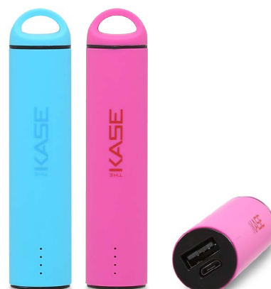
Batterie Nomade, jusqu'à 150 % de batterie en plus, où que vous soyez 19€90