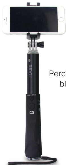
Perche télescopique bluetooth pour selfie 49€90