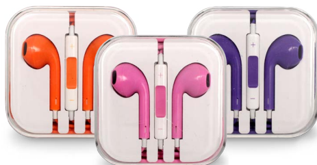
Écouteur avec micro et télécommande 19€90