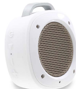
Haut-parleur portable bluetooth avec microphone 39€90