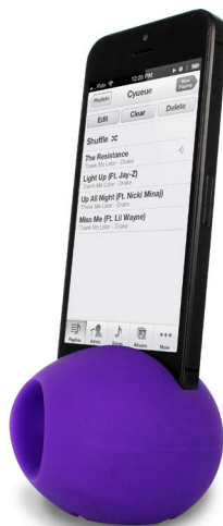
Œuf amplificateur de son 19€90