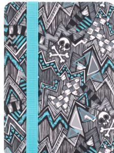
TurnFolio (iPad Air, iPad mini, universels, avec clavier)

Merci d'avance de confirmer votre passage sur le stand Griffin au ShowStoppers auprès du service de presse ci-dessous.