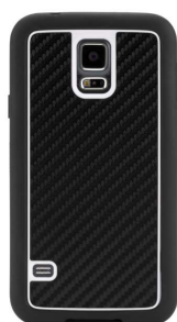
Identity pour Galaxy S5