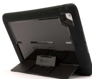
Survivor Slim pour iPad Air