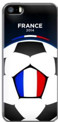
FOOTBALL FEVER - FRANCE FOOTBALL WORLD SOCCER TEAM 2014 - FRENCH FANS FLAG par MADOTTA