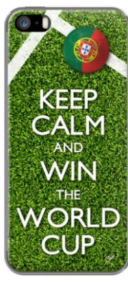
PORTUGAL - LA COUPE DU MONDE DE FOOT par ZUB