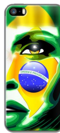
BRAZIL FLAG GIRL PORTRAIT par BLUEDARKART

À partir de 19.90 € dans 120 boutiques The KASE implantées dans toute la France. Les clients peuvent personnaliser et commander directement leur coque sur le site internet de la marque : www.thekase.com . Ils ont la possibilité de se rendre en boutique ou de se faire livrer à domicile.