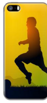
SOCCER PLAYER par GIORDANO AITA