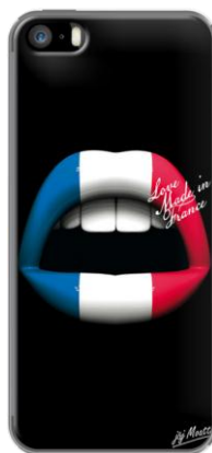
LIPS 3S MADE IN FRANCE par J&J MOATI