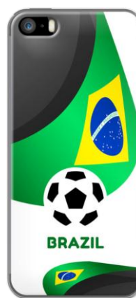
FOOTBALL FEVER - BRAZIL FOOTBALL WORLD SOCCER TEAM 2014 - BRAZILIAN FANS FLAG 3 par MADOTTA