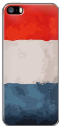
FOOTBALL FEVER - FRANCE par MR SHAFT