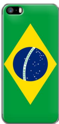
AUTHENTIC BRAZILIAN FLAG - OFFICIALLY THE FEDERATIVE REPUBLIC OF BRAZIL par BRUCESTANFIELDARTIST