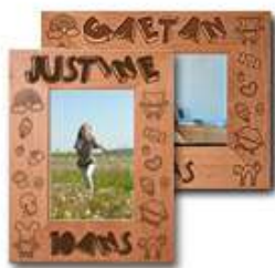
Cadre gravé anniversaire enfant