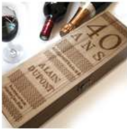
Caisse à Vin Anniversaire Age