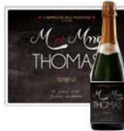
Champagne Mariage Personnalisé