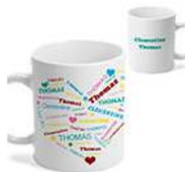
Mug Coeur Elle et Lui