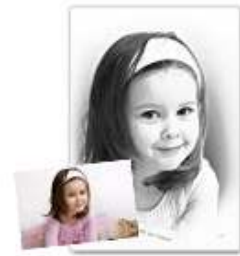
Portrait Façon Fusain