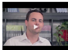
Chapitre 3 - Organiser son texte