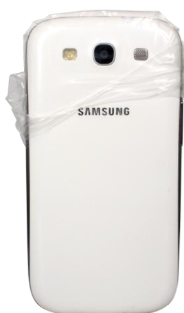
Sachet waterproof à usage unique 15.90 €