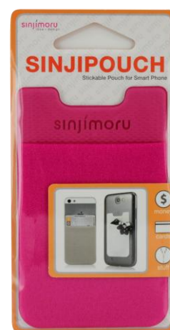
Mini pochette adhésive Porte-carte 12.90€