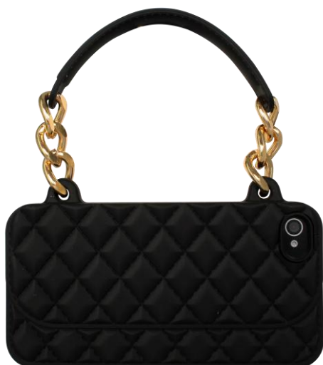
Etui en silicone sac à main type Chanel 19.90 €