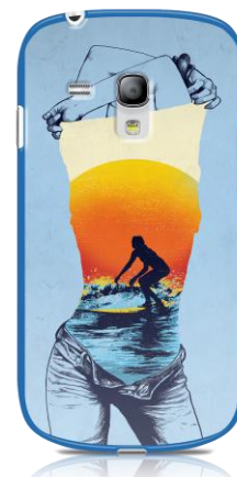
Coque S3 personnalisée collection « I AM EXOTIC » 34.90 €