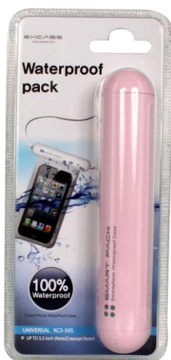
Tube avec housse waterproof 49.90 €

A l'approche des vacances d'été, The Kase , marque d'accessoires de mode pour smartphones et tablettes, propose dans ses boutiques de nombreux accessoires utiles et branchés pour se faciliter la vie sur la plage comme en soirée ! Etuis waterproof, amplificateur de son pour la plage, coque façon sac à main pour son smartphone, pochette adhésive pour sa carte bleue... Ses produits existent en différents coloris pour un été pétillant et connecté !