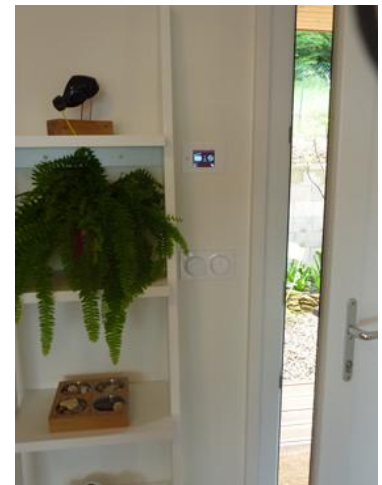
Ecran tactile à l'entrée