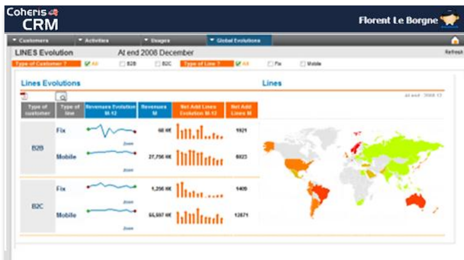
Le reporting agile de CRM 5.5