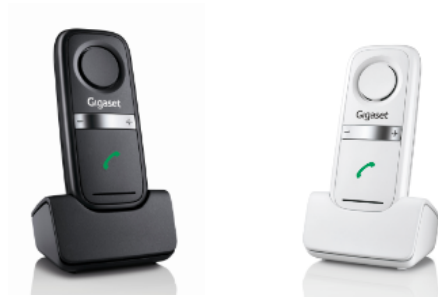
Le Gigaset L410

Le clip mains-libres Gigaset L410 peut être utilisé avec l'ensemble des téléphones Gigaset et stations de base DECT d'autres fabricants. Le L410 est disponible en noir et en blanc, au prix public conseillé de 49,99 euros.