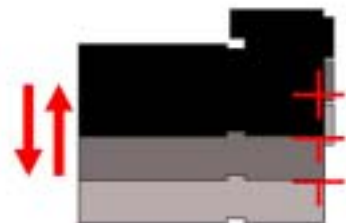
Vibrations linéaires de l'appareil

Courbevoie, 22 juillet 2009 : Canon annonce la mise au point du stabilisateur d'image optique hybride (IS hybride), premier stabilisateur d'image optique au monde* capable de compenser à la fois les vibrations angulaires et linéaires de l'appareil photo. Cette technologie sera bientôt intégrée à un objectif interchangeable pour reflex dont la commercialisation est prévue avant la fin de l'année 2009.