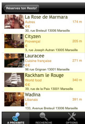
Vos restaurants à proximités

« a Table », l'unique application de l'Apple store qui vous permet de réservez en temps réel un restaurant sans téléphoner . L'application est disponible gratuitement depuis le 30 Avril en 3 langues Français/Anglais/Espagnol. Elle compte en quelques jours plus de 10 000 téléchargements en France.