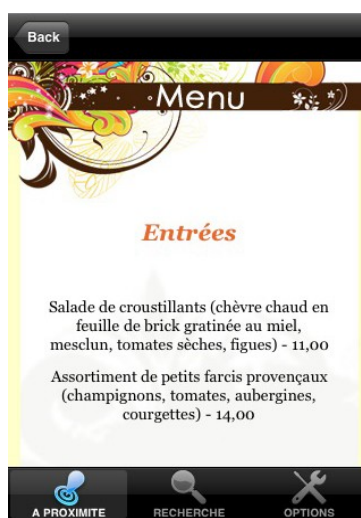
Idées de Menu