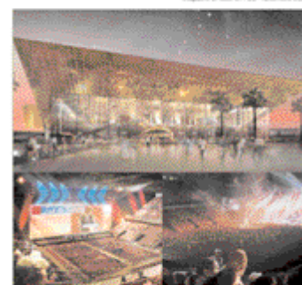
La Grande Salle à Montpellier