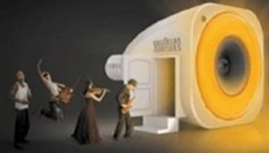
More than a light bulb !

Communiqué de presse, Le 03 novembre 2015