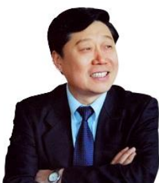
Zhang Ruimin, PDG et Président du Conseil d'Administration du Groupe Haier

Le 26 décembre 1984, début d'une période de réforme économique chinoise, Zhang Ruimin reprenait une usine de réfrigérateurs de Qingdao, alors en difficulté, avec ses 600 travailleurs. Suite à plusieurs plaintes clients, et pour souligner son exigence très forte en matière de qualité produits, Mr. Ruimin décidait alors d'aligner plusieurs modèles défectueux dans la cour de l'usine pour les détruire à l'aide d'un marteau ...et ce, devant l'ensemble des salariés. Ces derniers furent alors invités à faire de même et Mr Ruimin déclara à l'époque : « Il n'y a pas de qualité A, B, C, ou D. Il y a seulement l'acceptable et l'inacceptable ». C'est ainsi que depuis 30 ans, Haier a toujours mis un point d'honneur à placer la qualité produit au cœur de sa stratégie.