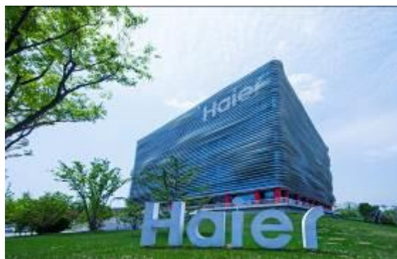
Siège social de Haier à Qingdao

➤ Haier a été nommée 10ème entreprise la plus innovante dans le monde par le magazine Américain Newsweek Magazine (décembre 2010)