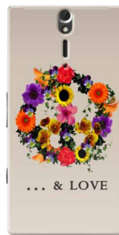
Peace & Love by LES CAPRICES DE FILLES