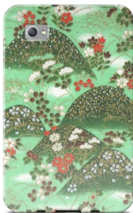
19 Seasons in Taipei by THE GRIFFIN PASSANT