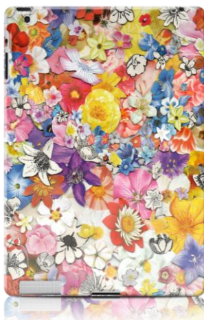
FLOWERS 2 by BEN GILES