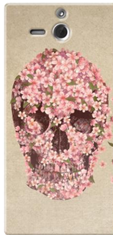
A Beautiful Death by TERRY FAN