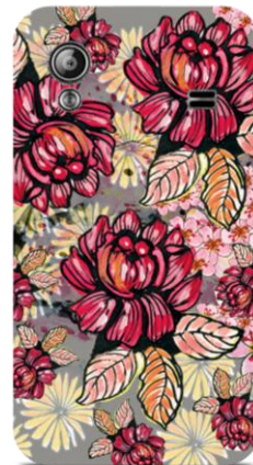
Roses and Cherry Blossom Patter by FELICIA ATANASIU