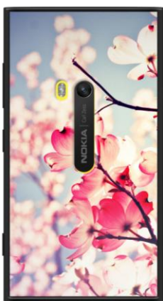
Dialogue With the Sky Blue

Petit florilège de la collection « I am Bucolik » :