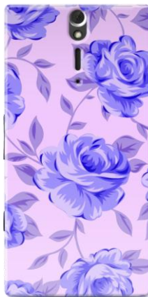
Blue Roses by YLENIA