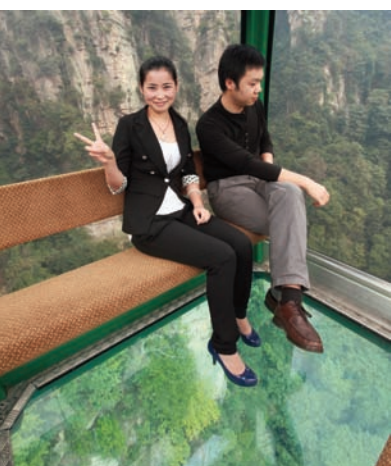
SIGMA en Chine