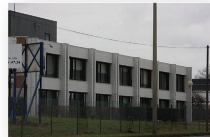
Le site EURO CRM de Lisieux 3 500 m 2 sur deux niveaux