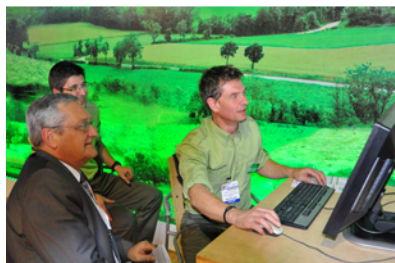
Démonstration SIG auprès des élus Salon des Maires 2010

Grâce aux technologies d'Esri France –analyse et édition cartographique- les équipes de l'ONF définissent et hiérarchisent les enjeux, les objectifs et les contraintes à plus ou moins long terme relatifs à l'aménagement forestier.