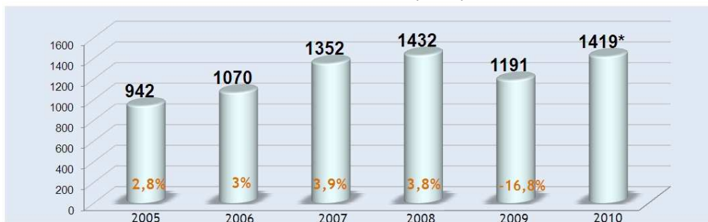
Nombre de transmissions d'entreprises par année

Ce sont ainsi, en moyenne, 18% des points de vente au sein d'un même réseau qui seront concernés dans ces transmissions, et plus particulièrement, ceux dans le domaine de l'alimentaire ( 33,5% ), du B to B ( 22% ) et de l'équipement de la personne et des loisirs ( 20% ).