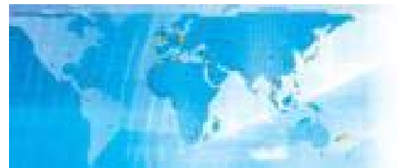
Interventions dans 110 pays - filiales dans 8 pays

Tibco retail représente 15% du CA Entreprises