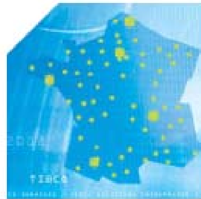
68 points techniques à moins de 2H de tout point du territoire.